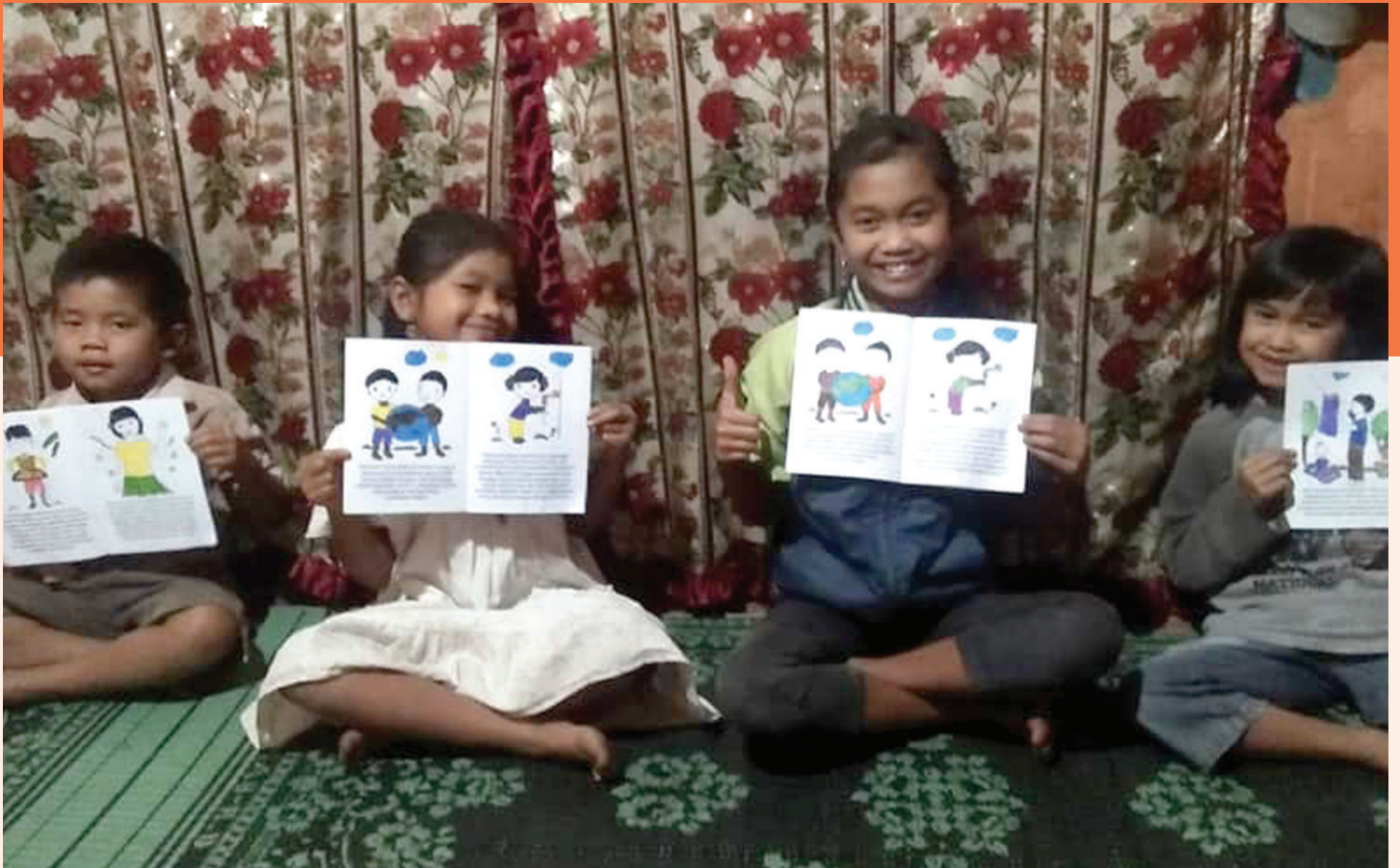
Les plus jeunes membres de la famille de Gelora lors de sa visite dans son village pour parler du coronavirus.