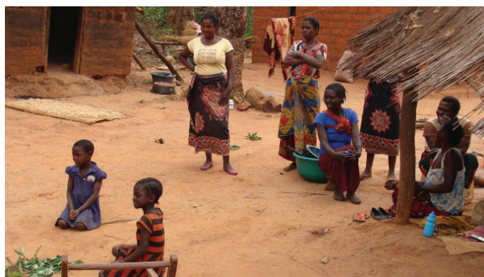
Des enfants instruits par un frère ou une sœur pendant que les parents surveillent.

Servir les enfants de cette manière nous a permis de ne pas lâcher prise et nous a également donné l'espoir que la pandémie passera en temps voulu. Nous remercions simplement Dieu que Mwinilunga n'ait pas été trop touchée par rapport à d'autres villes comme Kabwe et Lusaka."