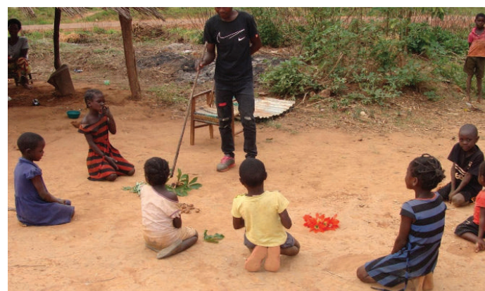
Enfants apprenant avec des parents participant également à distance