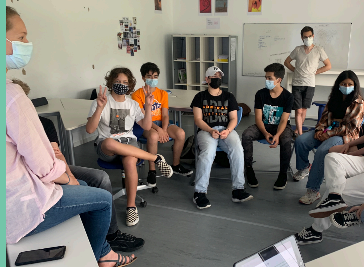
Discussion sur le court-métrage Mercy's Blessing, durant l'heure de « vie de classe » des élèves de l'école internationale de Mondorf-les-Bains.