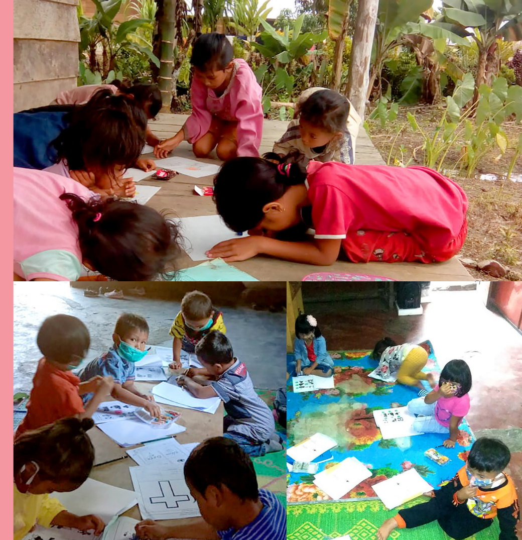
Groupes d'enfants travaillant à la maison, Sumatra

visites à domicile. Cette solution a permis de trouver un équilibre entre la nécessité d'adapter l'enseignement à la crise sanitaire et la nécessité de trouver un moyen de soutenir les parents qui ne sont pas en mesure d'aider leurs enfants à faire leurs devoirs. Finalement, en septembre 2021, le gouvernement a ré-autorisé l'apprentissage en présentiel.