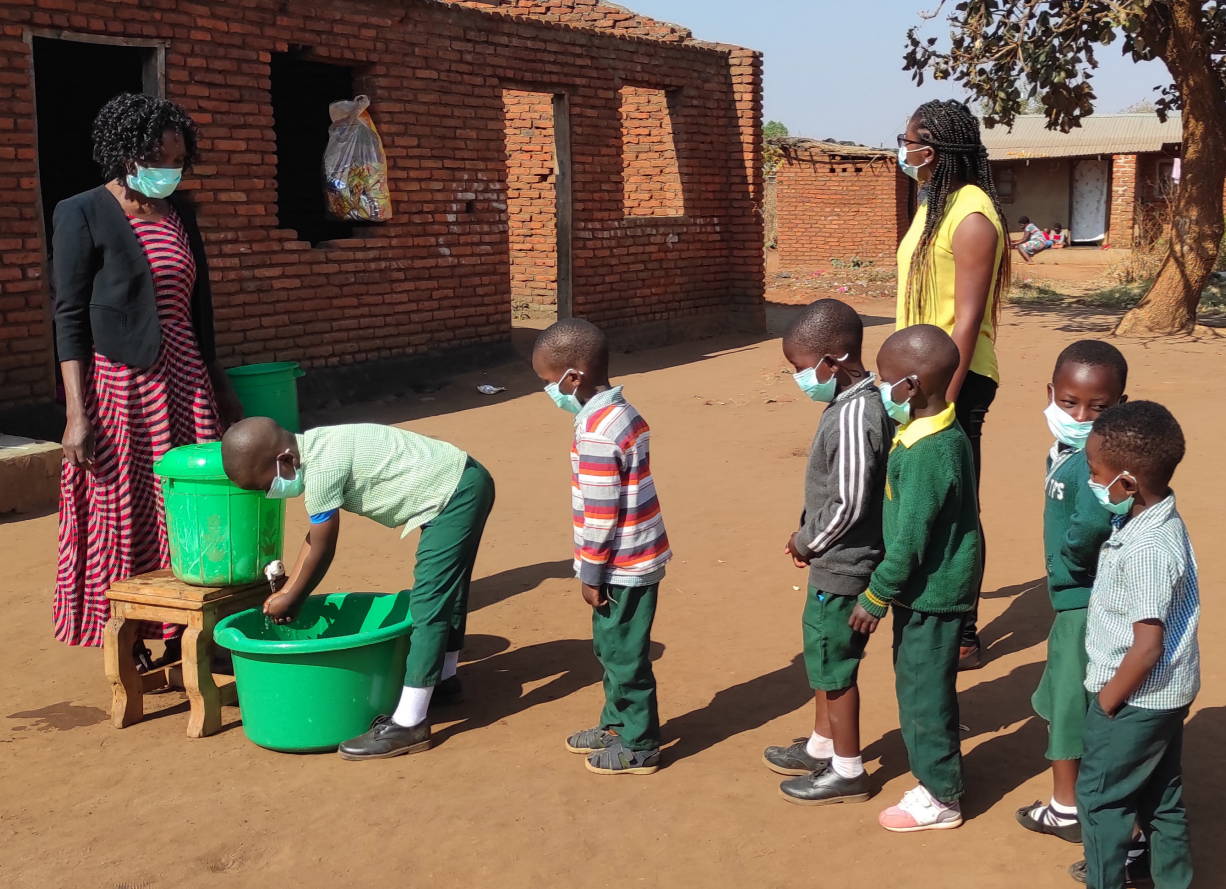
Lavage des mains avant d'entrer en classe